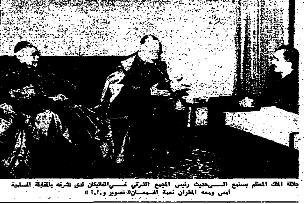
جلالة الملك العظيم يستمع للصحفيين رئيس المجمع الشرقي في القديكان لدى شرته بأقلبية السلبية أمس ومعهم المهران نعمة السهمان تصوير ١٠.٢٠

٧٥ ألف لاجئ وتنازع شردوا من الأغوار بعد العدوان الأخير الأمم المتحدة - رويتر - ناشدت الأمم المتحدة جميع الحكومات التبرع بالمال للاعتناء بسبل جديد من اللاجئين العرب من غور الأردن . وقال المستر لويس ميتشلمور المتكلم باسم للوكالة الدولية لإغاثة اللاجئين أن حوالي ٧٥ ألف لاجئ فروا من غور الأردن المرتفعات في الشرق نتيجة القتال الذي وقع بين الأردن وإسرائيل في الشهر الماضي . تأييد من يون ثانت وقال المستر ميتشلمور الذي أيدى نقت المستر العام للأمم المتحدة نداه أنه لم تتوفر تبرعات خاصة في هذا الوقت الحرج فان من الصعب معرفة كيفية تغطية الحاجة الضرورية للاجئين والنازحين . وقال في تقرير رفته الى مجلس الأمن الأحداث العسكرية الأخيرة وعلى الأخص تلك التي وقعت في الثاني من شباط الماضي و ١٥ منه الثارت ذكرا كثيرا بين السكان المدنيين الذين يتنقلون الجانبا الشرقي من وادي الأردن . وكتلت السلطات الأردنية قد تكررت أكثر من ٨٠ شخصا قتلوا وأصيب أكثر من ١٢٠ شخصا آخر بجروح بين البقية على صفحة ه عمود ٦